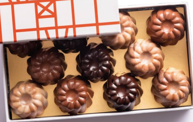
2 ème ÉTAGE